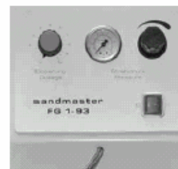
Manuelle Strahldruckeinstellung Manual blasting pressure adjustment Ajustage manuel de la pression de sablage