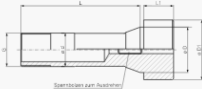
Spannbolzen zum Ausdrehen