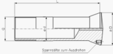
Spannstifte zum Ausdrehen

364E-0.0 364E-0.1 364E-1.1 364E-1.2 364E-2.1 364E-2.2 364E-3.1 364E-3.2 366E-0.0 366E-0.1 366E-2.1 366E-2.2 366E-3.1 366E-3.2 366E-4.1 366E-4.2 367E-0.0 367E-0.1 367E-2.1 367E-2.2 367E-3.1 367E-3.2 367E-4.1 367E-4.2 385E-0.0 385E-0.1 385E-2.1 385E-2.2 385E-3.1 385E-3.2 385E-4.1 385E-4.2 386E-0.0 386E-0.1 386E-2.1 386E-2.2 386E-3.1 386E-3.2 386E-4.1 386E-4.2 390E-0.0